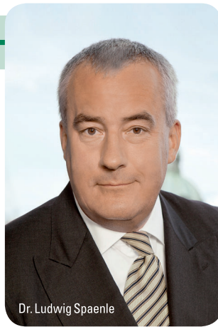
Dr. Ludwig Spaenle